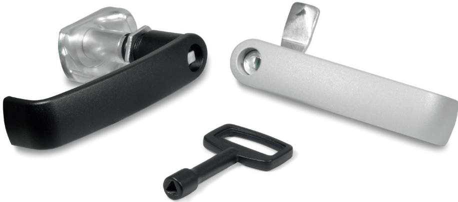
Türverriegelungen mit Bügelgriff GN 119.3 Verriegelungen mit Bügelgriff GN 115.7 → Seite 1096 Steckschlüssel GN 119.2 → Seite 1136